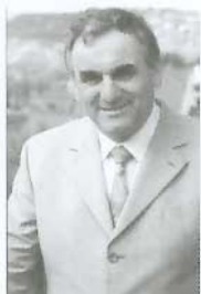
Martin Bertling Bürgermeister Profile Naumburg und Umgebung