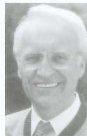
Dr. Edmund Stoiber Ministerpräsident Profile Rosenheim