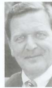
Gerhard Schröder Alt-Bundeskanzler Profile Hannover