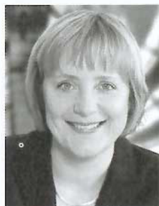
Dr. Angela Merkel Bundeskanzlerin Profile Stralsund