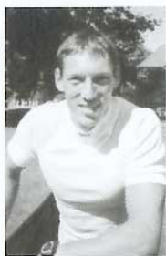
Andreas Dittmer Kanu-Olympiasieger Profile Neubrandenburg